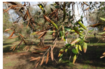
Sintomas em oliveira