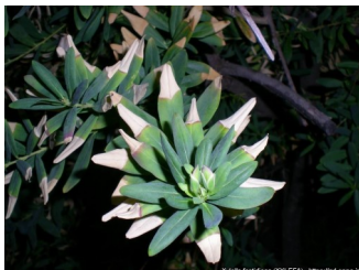
Sintomas em Polygala