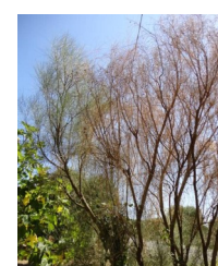
Sintomas em giesta