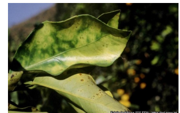
Sintomas em citrinos