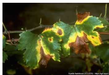
Sintomas em videira