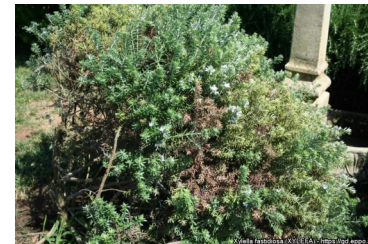
Sintomas em Westringia fruticosa