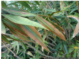
Sintomas em loendro

A Direção Geral de Alimentação e Veterinária elaborou o ofício circular nº 34/2017, de 20 de dezembro, sobre " Xylella fastidiosa - Alteração da legislação, novos requisitos para a produção de plantas ", o qual divulgamos e se encontra disponível em: http://www.dgv.min-agricultura.pt/portal/page/portal/DGV/genericos?generico=4054225&cboui=4054225