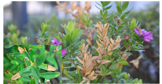
Sintomas em Polygala myrtifolia

Disponibiliza-se para o efeito, o endereço da área de intervenção da DRAPLVT: http://www.draplvt.mamaot.pt/DRAPLVT/Informacao-Institucional/Area-Intervencao/Pages/Area-Intervencao.aspx e o link do site http://www.draplvt.mamaot.pt/alimentacao/Prospeccao-pragas-doencas/Bacteria_Xylella_fastidiosa/Pages/Bacteria-Xylella-fastidiosa.aspx .